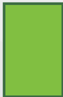
PÁGINA INTEIRA 21x27,7cm