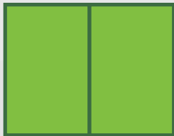
PÁGINA DUPLA 42x27,7cm