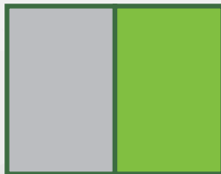
VERSO DA CONTRACAPA 21x27,7cm